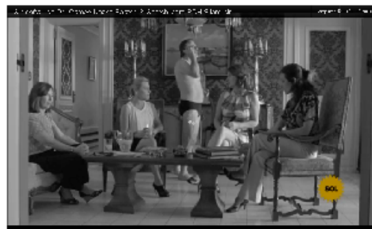
Fig. 2. Fotograma de spot sobre BGHSilent air, premiado en el festival El Sol.