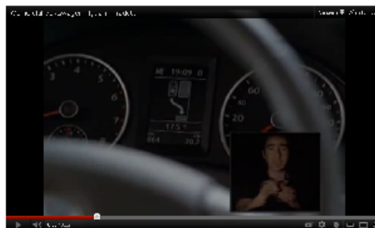
Fig. 3. Fotograma de spot de Volkswagen Tiguan donde el hombre nos enseña cómo debe aparcarse el automóvil

Veamos algunos ejemplos más en los que resalta claramente este tipo de estereotipación: