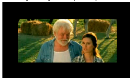
Fig. 6. Fotograma de spot de impulso