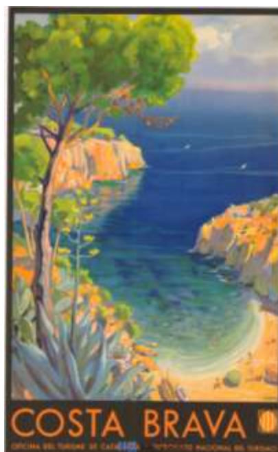
Imagen 2 - Cartel promocional de la Costa Brava, obra de Eduard Janer. Inicialmente publicado por la Oficina de Turismo de Catalunya y el Patronato Nacional de Turismo (1933), reditado en 2010 por el Patronato de Turismo Costa Brava – Girona.

Los producidos por entes públicos proponen imágenes vinculadas a la naturaleza (el mar) y el patrimonio tangible e intangible, conscientes que las imágenes marítimas en sí mismas son de difícil ubicación y compiten con gran parte de las playas y costas mediterráneas. Cuando el cartel o el folleto turístico emiten los valores de la marca general Costa Brava, como en la imagen siguiente, los valores más generales del paisaje de la costa quedan representados, de manera que buena cantidad de playas se parecen a la imagen. Por ejemplo, tomando como muestra el cartel de Eduard Janer (1933), encargado por la Oficina de Turismo de Catalunya juntamente con el Patronato Nacional de Turismo del gobierno español, es paradigmático en este aspecto: mar, rocas, transparencia, playa no masificada, pinos.