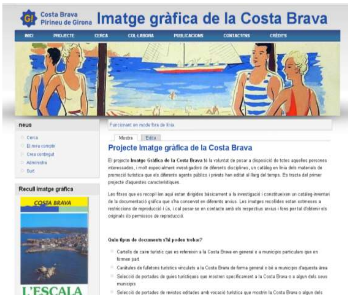
Imagen 1 - Home de la web del proyecto Imagen Gráfica de la Costa Brava (no publicada oficialmente).