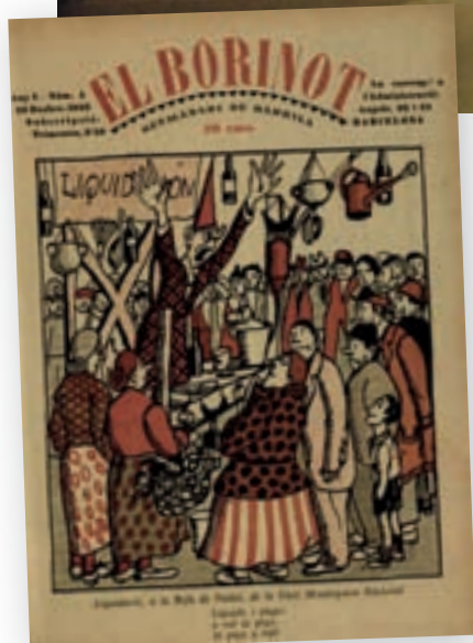
>> Il·lustració de Josep Aragay per a la portada de la revista El Borinot , núm. 4, any I, de 20 de desembre de 1923.

Aragay era conscient que lluny de Barcelona hi havia molta feina a fer. Aquest fet —en sintonia amb el bell ideal noucentista de la Catalunya-ciutat— explica el seu pas per la política. Adscrit a Acció Catalana Republicana, l'any 1934 va ser escollit regidor a l'Ajuntament de Breda, des d'on va impulsar, entre altres iniciatives, la construcció d'un grup escolar (frustrat per