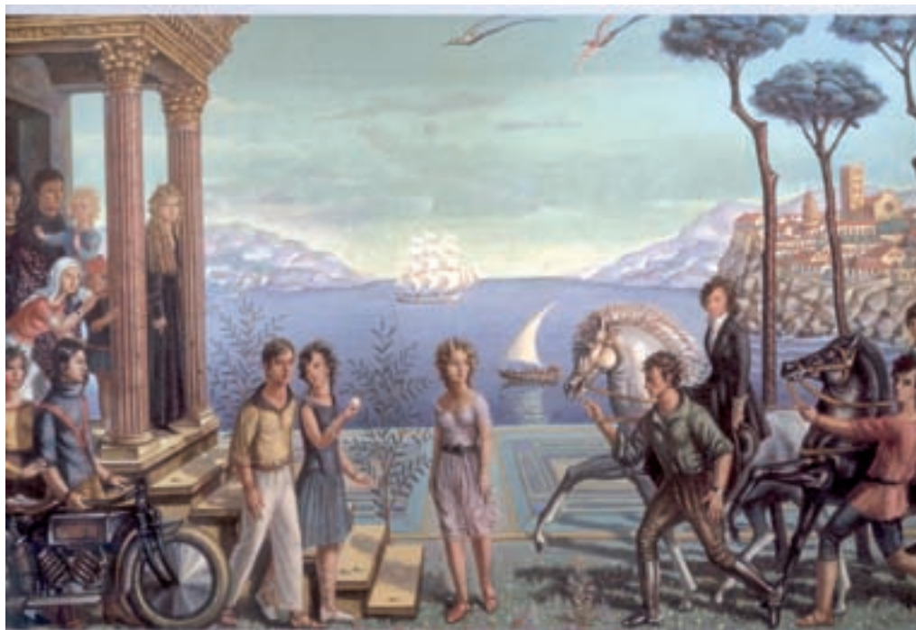
>> Vacances (1923). Oli sobre tela (2,60 x 4,10 m). Museu Municipal Josep Aragay de Breda.

És en aquest sentit —i amb tota la coherència ideològica— que Aragay sacrificà el nervi, la grapa i el caràcter de la seva pintura anterior a favor d'un estil més concís, més depurat, més clàssic. Però la pintura de l'etapa post-italiana, segons un sector important de la crítica, no estava a l'alçada del seu «enlairat ideari». Segons Eugeni d'Ors, Aragay fou castigat «per haver massa amat la Itàlia»; segons Carles Riba, «a Itàlia hi guanyà la joia de l'home i hi va perdre la tristesa de l'artista».