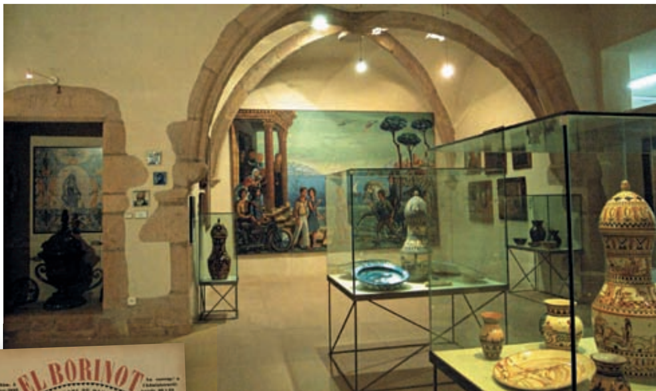
>> Museu Municipal Josep Aragay de Breda, amb l'emblemàtica pintura Vacances al fons .

SALVADOR BOSCH PUBLICADA AL LLIBRE "BREDÀ, ENTORN I PATRIMONI", ED. COMPENTUM SL., 2005