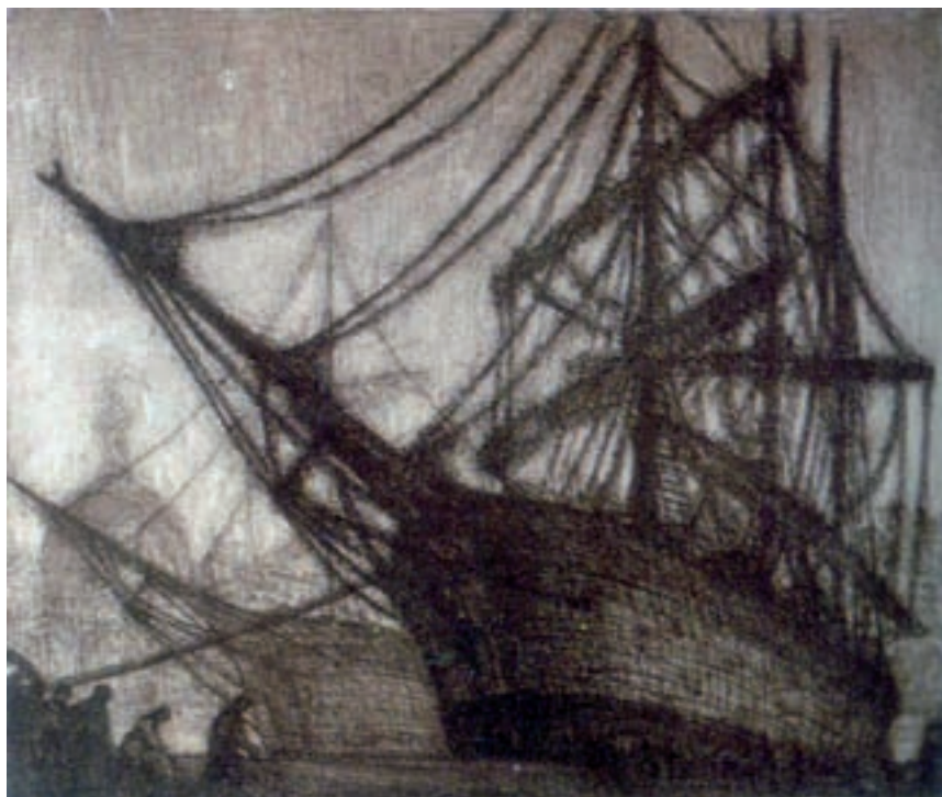
>> Vaixell negre (1911). Aiguafort. Museu Municipal Josep Aragay de Breda.