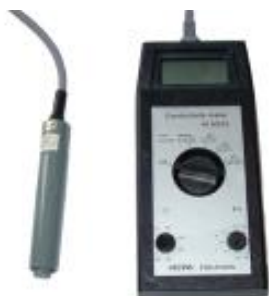
Foto 3. Conductímetre