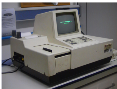
Foto 5. Espectrofotòmetre