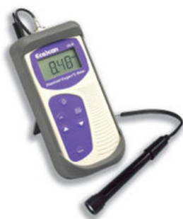
Foto 4. Oxímetre