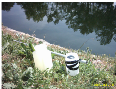
Foto 1. Instruments utilitzats.

L'aigua a analitzar ha estat recollida de la capa més superficial de la bassa. S'ha emprat un pal amb un recipient lligat el final, per tal de poder recollir-la.