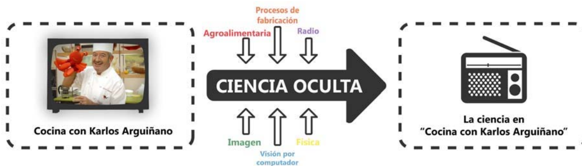
Figura 1. Objetivo del proyecto Arguiñano.

Uno de los principales retos planteados por el equipo multidisciplinar de profesores fue diseñar un plan suficientemente transversal que permitiera, de forma simultánea, desarrollar competencias específicas, propias de cada asignatura y competencias transversales, comunes a todas ellas. Entre las diferentes competencias transversales que se pudieran desarrollar en un proyecto fundamentado en el aprendizaje autónomo y compartido se consideraron: trabajar en equipo, diseñar propuestas creativas, comunicarse oralmente y por escrito, y utilizar tecnologías de la información y la comunicación.