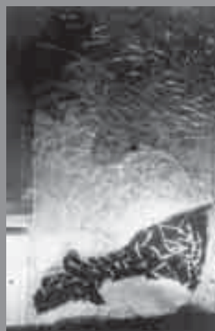
Detalls del vitrall realitzat per a la Capella de Jesús de la Seu Vella de Lleida

XIII), identifica la noció del que és bell amb la llum. Tots els cossos resplendeixen i són més o menys bells segons el seu grau de resplendor 3 . "La llum llueix en la tenebra, però la tenebra no la va abraçar." (Joan, I, 4-9). La llum, com un dels elements que simbolitzen també la idea del que és immaterial, la qual travessa el vidre sense alterar-lo, serveix Dante per desenvolupar metafòricament la idea de la divinitat: