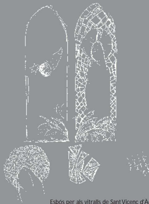
Esbós per als vitralls de Sant Vicenç d'Ager