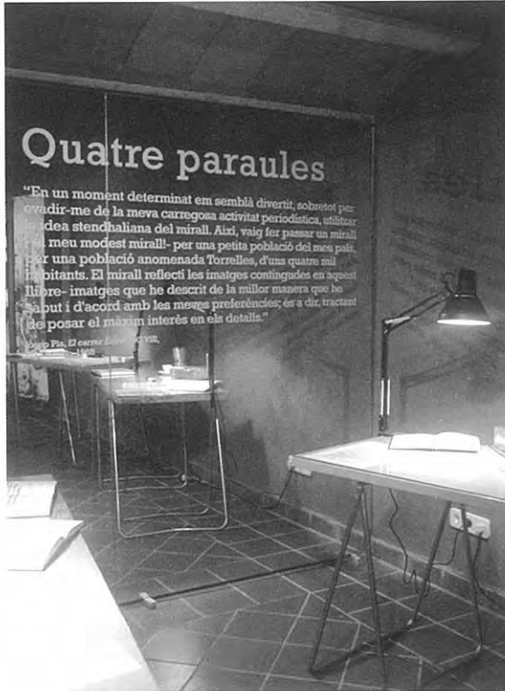
Fragment de l'exposició El carrer Estret, la poètica de la banalitat 08-12-2001