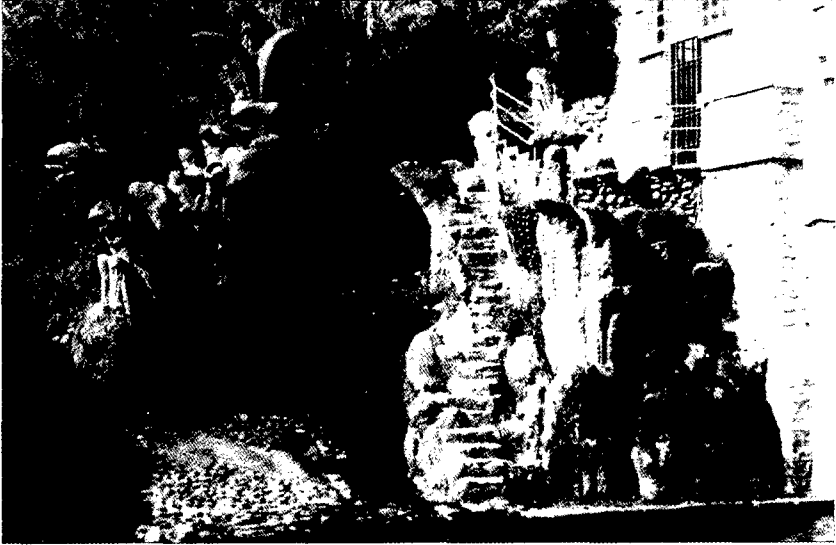
Els monstres de la central de Bescanó.

del canal trobem una escala —llarga, estreta, sinuosa i sense barana— que baixa fins a les arcades de sortida de les dues turbines. L'escala està flanquejada de dalt a baix per escultures de formigó de l'alçada d'una persona. Són representacions esquemàtiques de motius vegetals: flors acampanades, bolets i fulles. Aquesta vegetació mineral, que envolta i amaga un pou, recorda vagament les flors de lis, els lotus o les falgueres.