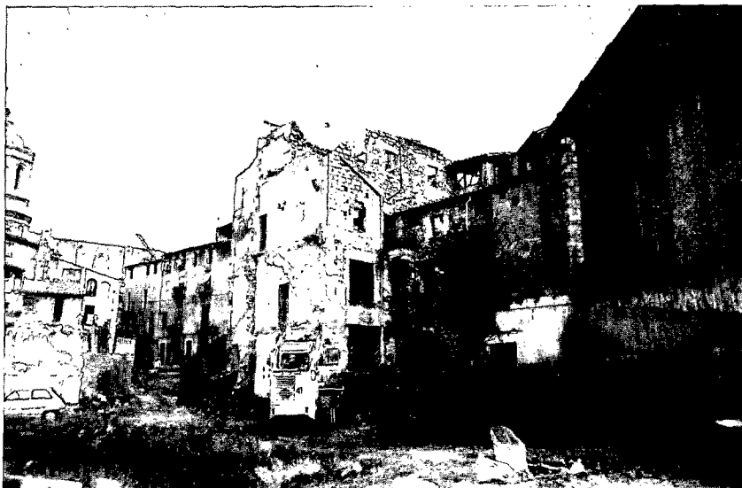
Fig. 1. Vista general de la zona 1 (pati superior) en començar la intervenció arqueològica.