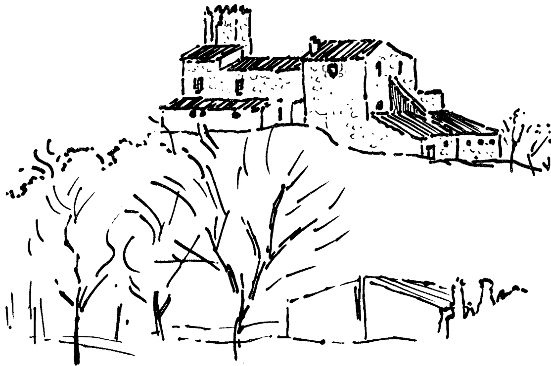
La Torre del Baró.