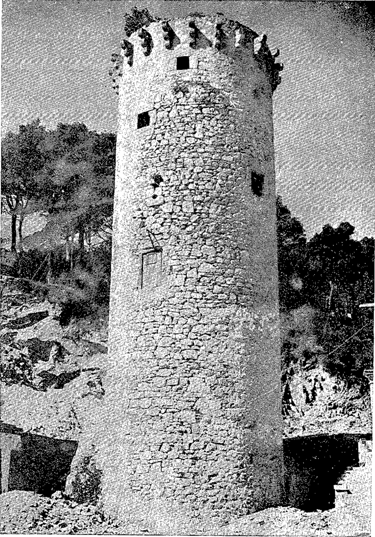
La Torre Valentina.