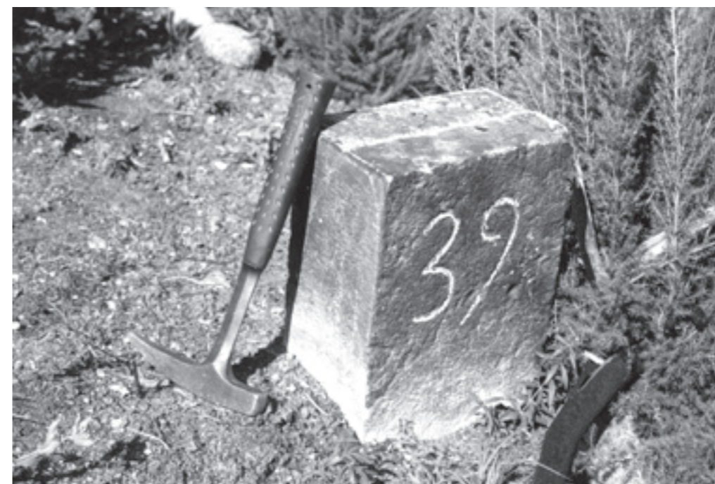
Fita calcària de dimensions més petites indicadora de separació de propietats particulars.

c) Es tracta d'una fita antiga aprofitada com a terme particular. Això no és gens estrany, ja que també el terme Gros i la fita annexa que es troba al cim del puig de Sant Benet, situada a la vora de la núm. 3 (1889) o núm. 15 (1924), totes dues de natura granítica i amb filloles la segona, porten en una de les