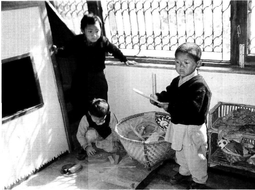
Els nens més petits de l'escola Daleki.