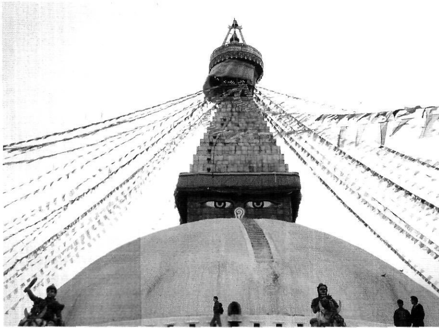
Estopa de Boudhanath.