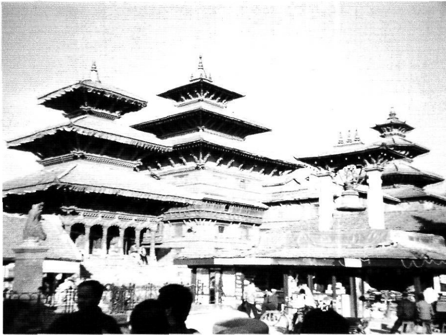
Durbar Square. Patan.