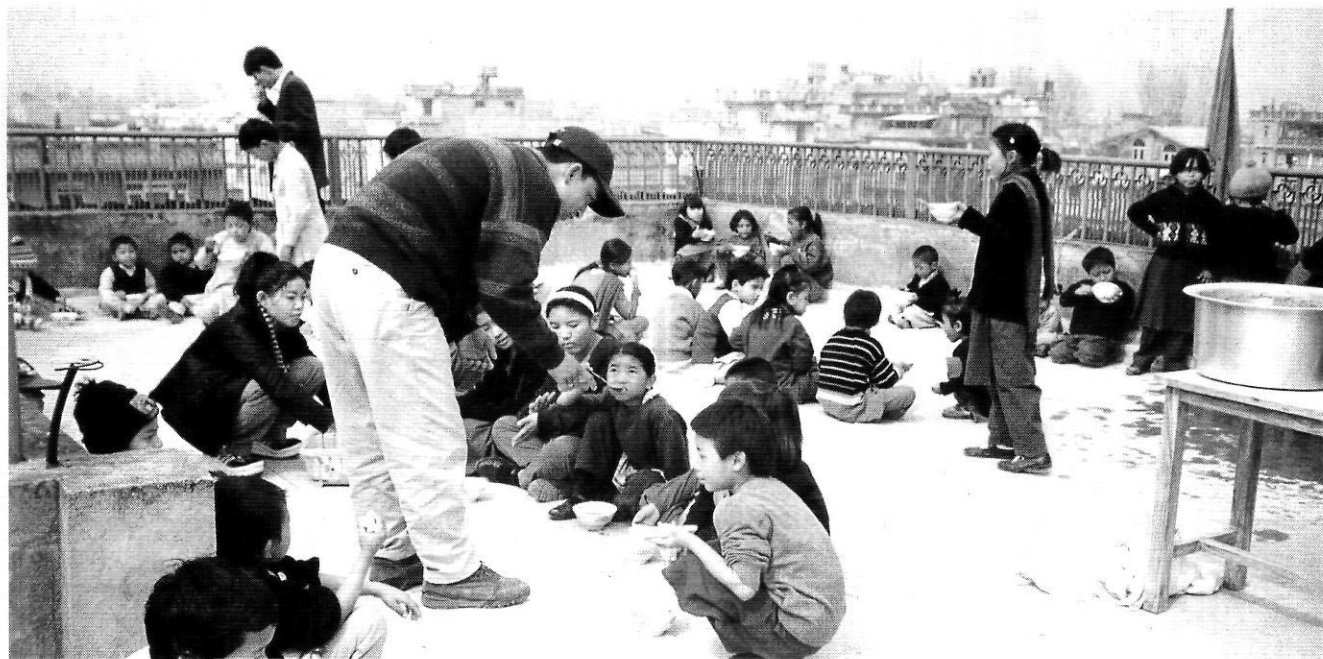
El menjador de l'escola Daleki.

col·laboradors. Cada padrí aporta 25.000 pessetes anuals que serveixen per pagar el menjar, les medecines, el transport escolar i el lloguer dels edificis. La Generalitat de Catalunya els ha concedit també una subvenció per a la direcció tècnica d'una nova escola que els arquitectes sense fronteres i el Col·legi d'Arquitectes de Barcelona estan construint, en aquest moment, per tal de poder disposar d'un edifici en propietat. Molts dels pares dels nens de l'escola Daleki estan ajudant com a voluntaris o amb uns sous molt baixos a tirar endavant el projecte del que s'anomenarà escola Catalunya.