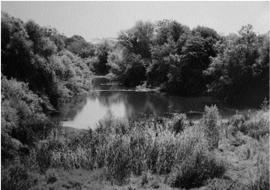
Pas del riu Manol per les proximitats de Sta. Llogaia d'Àlguema, punt en el qual encara gaudeix d'una vegetació de ribera prou ben conservada, aspecte que potencia el paper de connector ecològic i paisatgístic del riu entre els diversos àmbits territorials de la comarca.