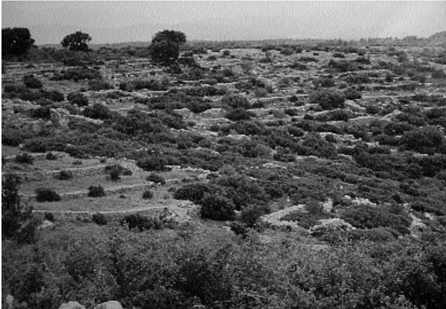
Perspectiva del sector de les garrigues, amb una bona mostra de les parets de pedra i de les terrasses associades, indicadores de l'antiga activitat agrícola, ja abandonada. Sector situat al nord-oest del turó del Bon Aire (límit entre els termes d'Avinyonet, Llers i Figueres).