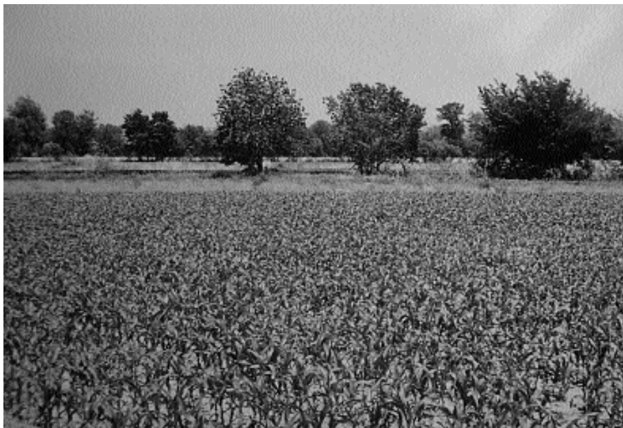
Camps de blat de moro a la plana agrícola de Vilatenim; s'aprecia, en segon terme, la intercalació de sanefes de vegetació arbustiva i arbòria lligada, sovint, a la presència de cursos d'aigua, canals o camins.