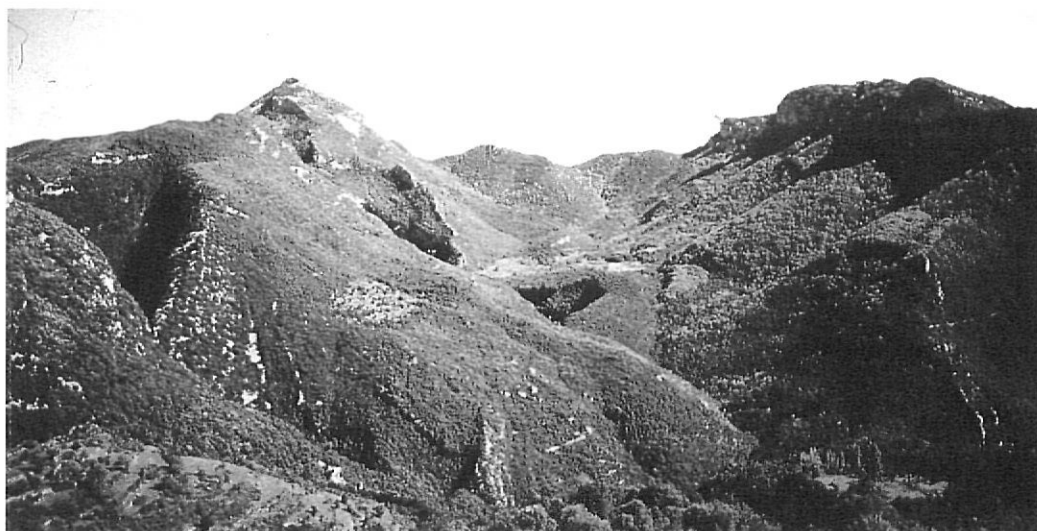
Una imatge de la petita vall de Riu, envoltada pel Puig de Bassegoda i els cingles de Gitarriu. El bosc és el gran dominador del paisatge.

«Mantenir la família fou impossible i per això se n'anaren. Fou aquesta falta —al meu entendre— de jornals hivernals el que produí despoblament de les valls de la Garrotxa més característiques. Paral·lelament l'atracció industrial d'Olot, de Banyoles, de Sant Joan les Fonts..., de Girona. La despoblació agafa una aspecte rodó ineluctable».