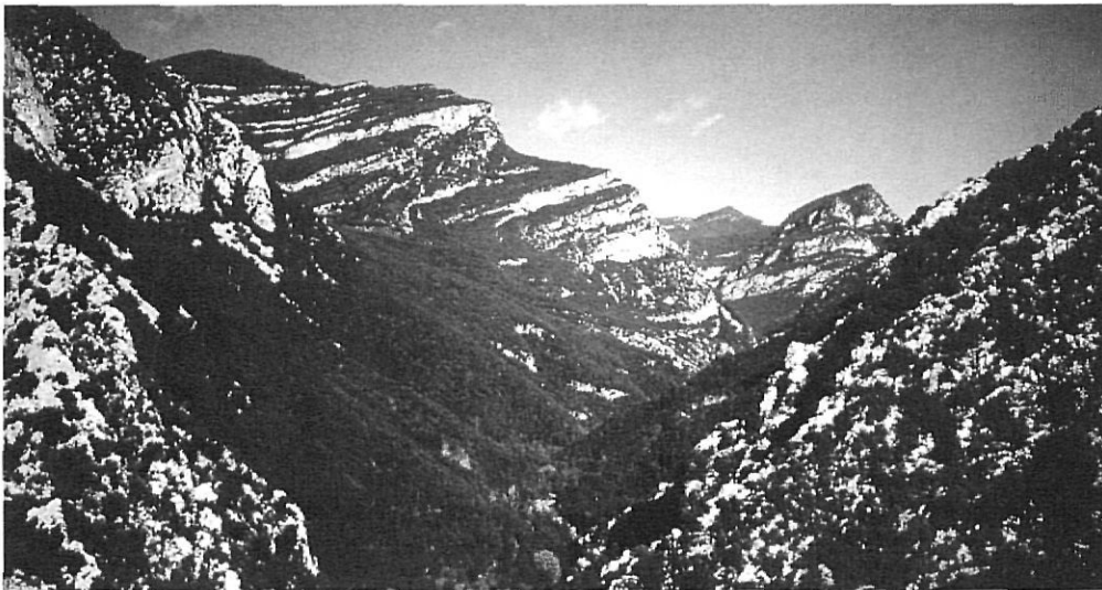
La vall de Sant Aniol, amb la muntanya del Brull al fons. Una imatge ben il·lustrativa d'aquesta terra aspra i de mala petja.

«...me feu passejar per uns i altres llocs, i a poc tornava a casa llassat i amb l'ànim més abatut que abans. Me semblà talment que aquella terra patia del meu propi mal, i que, igual que mon cos, s'arrossegava pel camí del cementiri. Ja no és aquella terra jovença i rumbosa com una núvia bosquerola que jo havia coneguda. Ses luxurioses arbredes van desapareixent destrelajades per l'artigaire estúpid i pel carboner explotador de la ignorància i la misèria del propietari i, empaïtada per la batuda, ha fugit també la fauna que abans li donava vida» (Vayreda, 1982, p. 23).