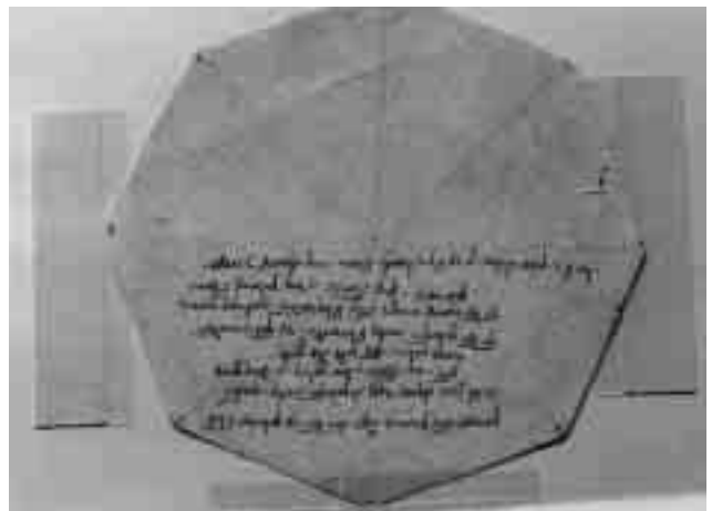
Plànol del campanar i a sota, part posterior del campanar

Pel que fa als treballs de reparació, van ser constants durant tot el segle XIV i van consistir en la reparació de teulades, latrines, paviments i finestres, tant de l'església com del claustre. També es van fer tasques de manteniment a la sagristia, principalment de portes.