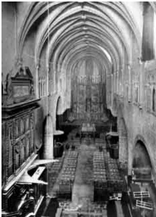
Nau central i cor de l'església de Sant Feliu de Girona.