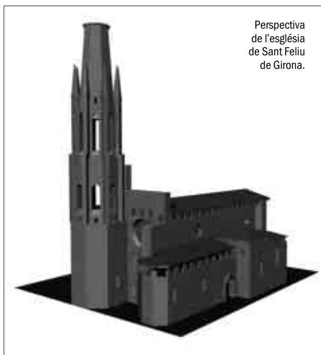
Perspectiva de l'església de Sant Felíu de Girona.

bla que s'esmenta, de forma indirecta, la catedralitat, i per tant la gran importància que tenia el temple de Sant Felíu de Girona. Aquestes referències arriben fins el segle XI. Les dades documentals i arqueològiques donen la prioritat a Sant Felíu com a església catedral, i ho referma el fet que no s'hagin trobat vestigis de l'antiga catedral preromànica durant les excavacions a la catedral.