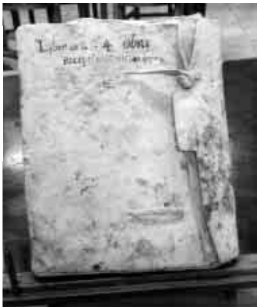
Llibre 4 de l'Obra de Sant Feliu de Girona.

De l'església anterior a la construïda al segle XIV, que alguns historiadors daten de final del segle XI o inici del segle XII i cataloguen com a romanicogòtica –de tres naus–, se'n conserven restes a les parts baixes del temple actual, fins a l'alçada del trifori. Així doncs, tenim una església on les parts baixes són romàniques, conservades després del setge de Felip l'Ardit l'any 1285, i les altes són gòtiques. Per acabar de situar aquest edifici seria de molta ajuda poder realitzar excavacions arqueològiques a l'interior del temple.