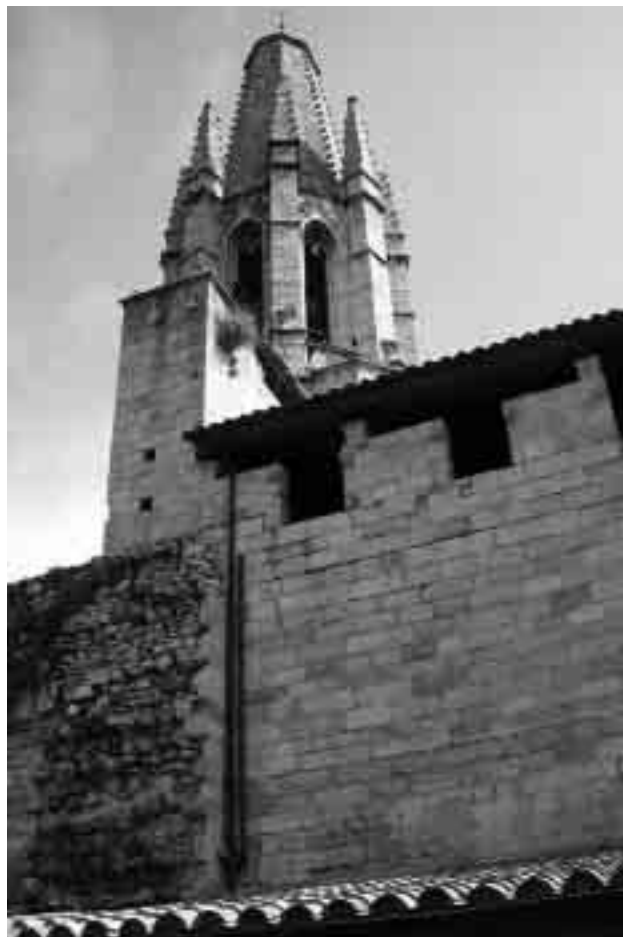
Campanar de l'església de Sant Feliu.