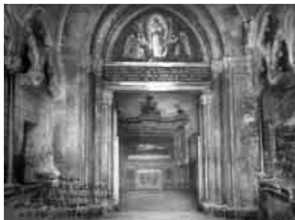
Entrada sud a l'església de Sant Feliu de Girona.