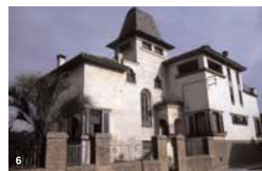
6. Xalet de la desapareguda Urbanització Teixidor (1928-1929), enderrocada l'any 1974.