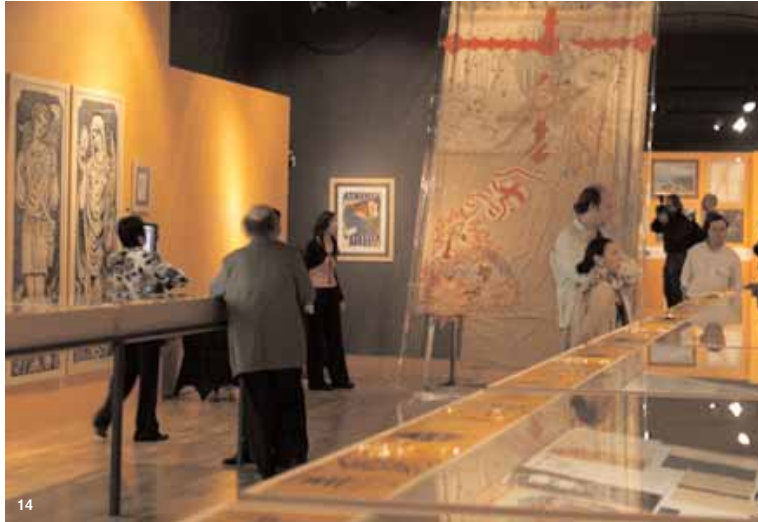
Castell-Platja d'Aro-S'Agaró, Sant Gregori, Palafrugell i La Vall d'en Bas.

L'exposició es planteja amb la voluntat d'oferir una visió de l'arquitecte clarament arrelat a les comarques de Girona. La intenció és presentar un arquitecte que va més enllà de la ciutat de Girona i es vincula al territori més ampli de la Demarcació. No es tracta d'una exposició purament d'arquitectura, sinó que, tot i que aquesta n'és un element determinant, es tenen molt en compte els vincles literaris i gràfics (dibuixos i imatges) que Rafael Masó va trenant amb el territori.