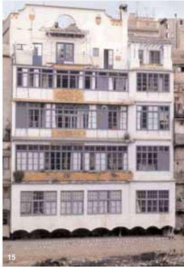
15. Casa Masó, seu de la Fundació Rafael Masó.