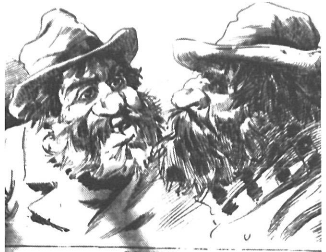
Lliurepensadors —a l'esquerra— i anarquistes —a la dreta—, segons el setmanari satíric carlista «Calacuerda», de Madrid, a la fi del segle XIX.