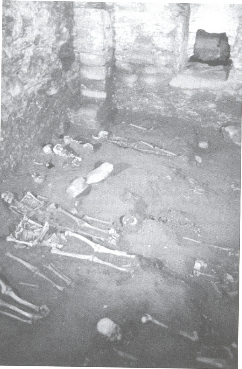
Fig. 4. Sagristia de l'església. Nivell d'inhumacions.