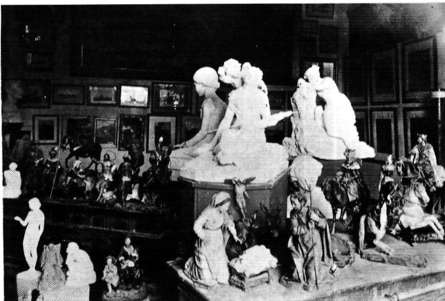
Sala del Museu d'Olot inaugurat l'any 1905.