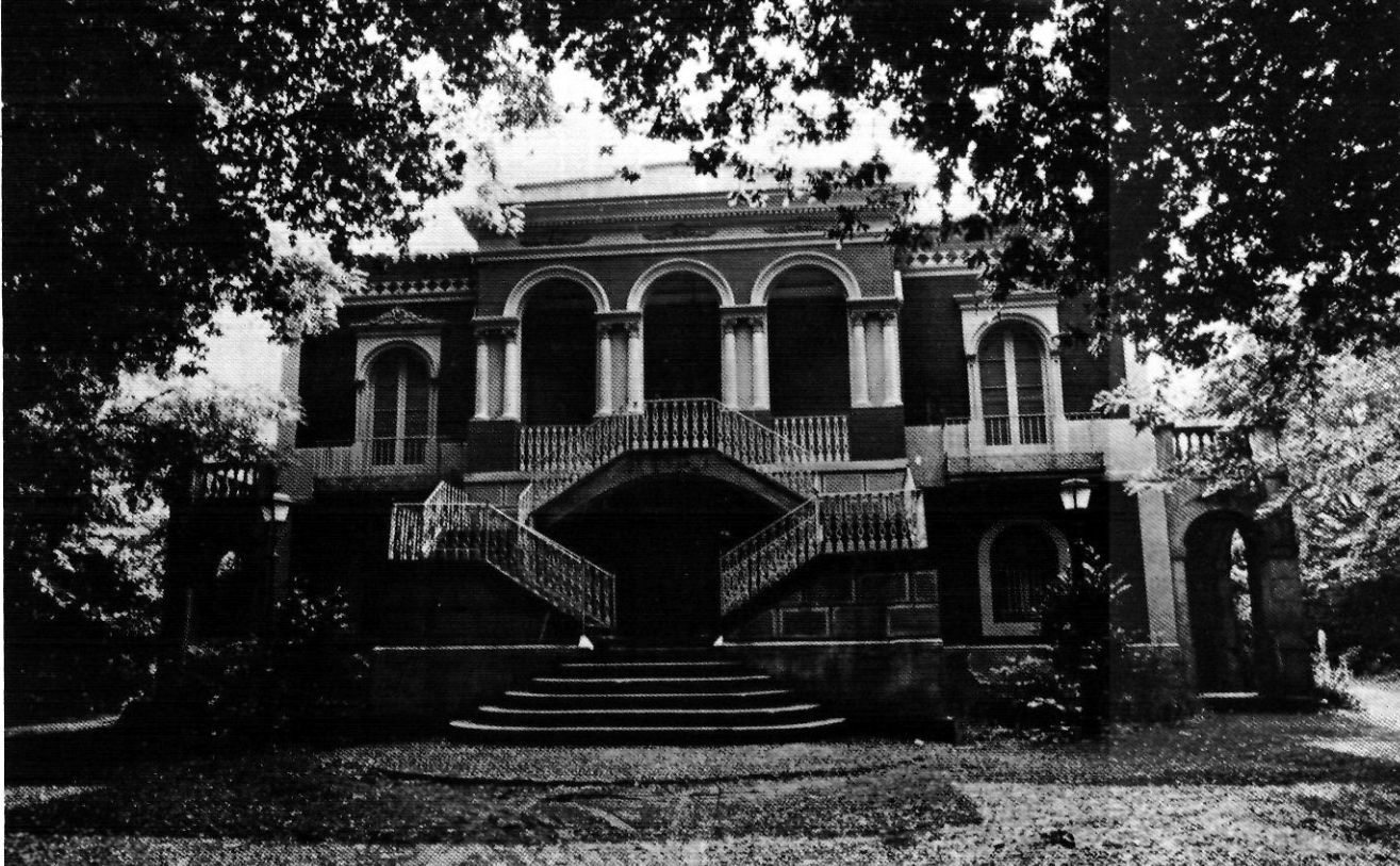
La Torre Castany del Parc Nou.

amb la seva mà hi ha produït. Des d'uns tipus de conreus i oficis artesanals (carboners, artigaires, culleraires) lligats a la terra, passant per unes determinades concepcions artístiques i intel·lectuals i arribant fins i tot a la implantació de determinades indústries, el paisatge ha estat un element clau. Es mostrarà la diferent visió i interpretació que l'home ha tingut de la natura, des de la perspectiva contemporània de cada època.