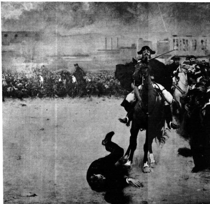
"La Càrrega", oli de Ramon Casas dipositat en el Museu Comarcal de la Garrotxa.