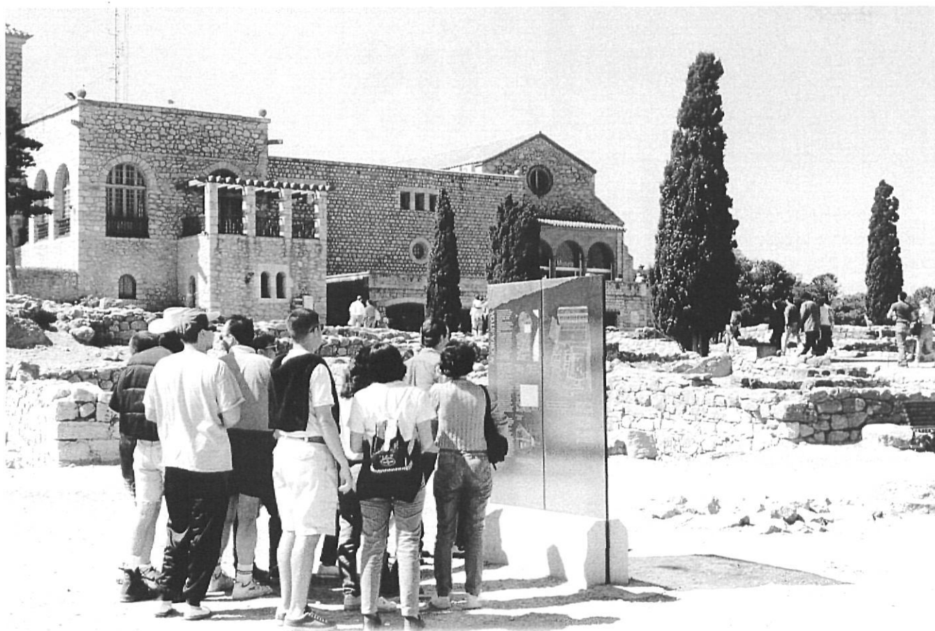
Visitants a Empúries.

la Garrotxa procedeixen de fora d'aquesta comarca i de més enllà de les comarques circumdants (Font: MCGO).