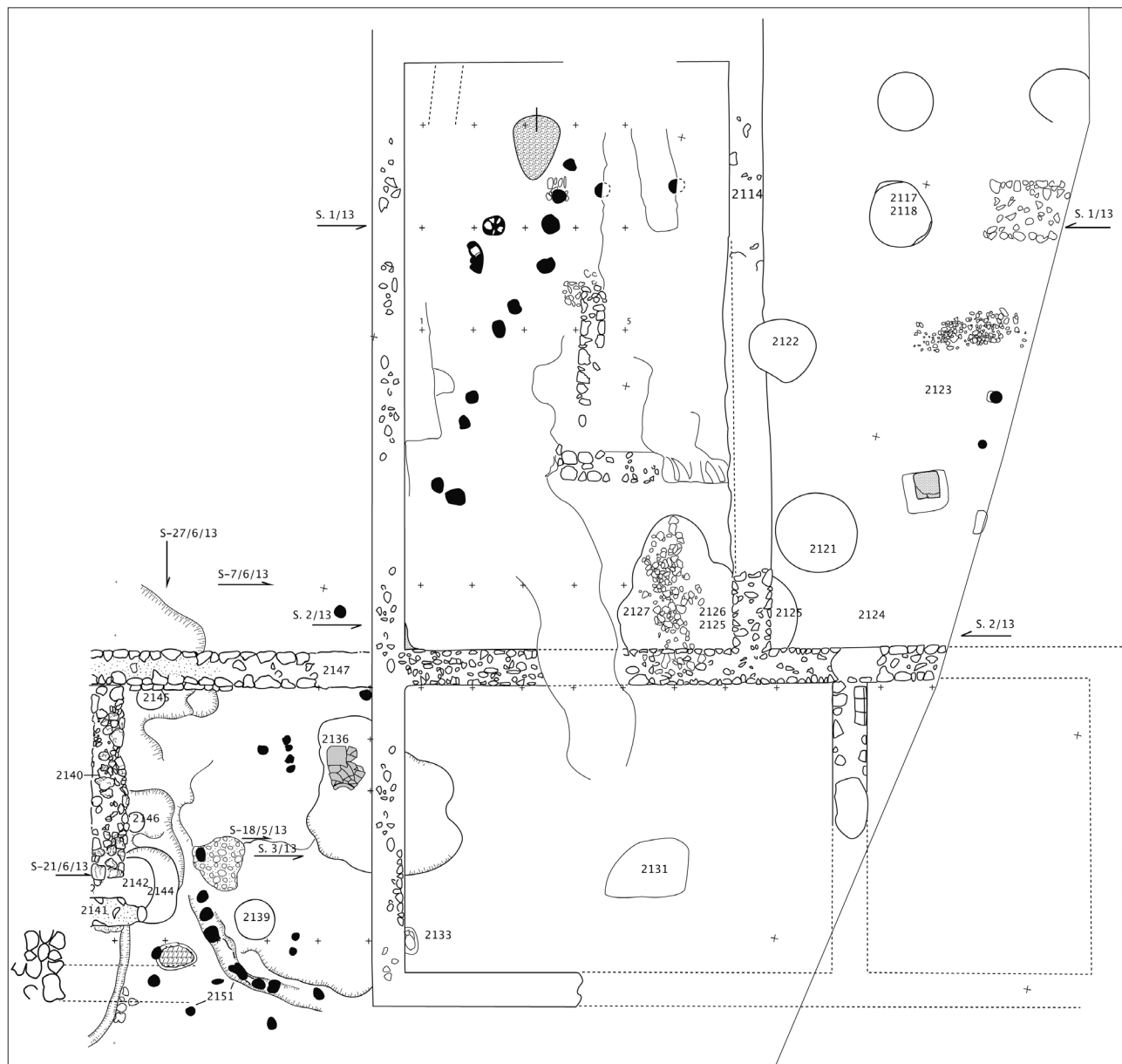
Figura 3. Planta general del sector excavat el 2013.

ra d'una dependència annexa que s'havia adossat al mur perimetral en una fase més recent. La seva construcció al damunt d'una fossa de deixalles d'època augustal i estrats amb materials del segle II que s'hi recolzen (però afectats per espoliacions recents), així com la tècnica constructiva, ens permet situar aquesta ampliació cap a les darreries del segle II, contemporània a la construcció de les termes, també adossades, en aquest cas, a la façana nord-oest del mur perimetral. Caldrà, en futures campanyes, continuar l'excavació de tot l'exterior d'aquesta façana per comprovar com s'estructura el conjunt d'ampliacions o remodelacions altimperials.