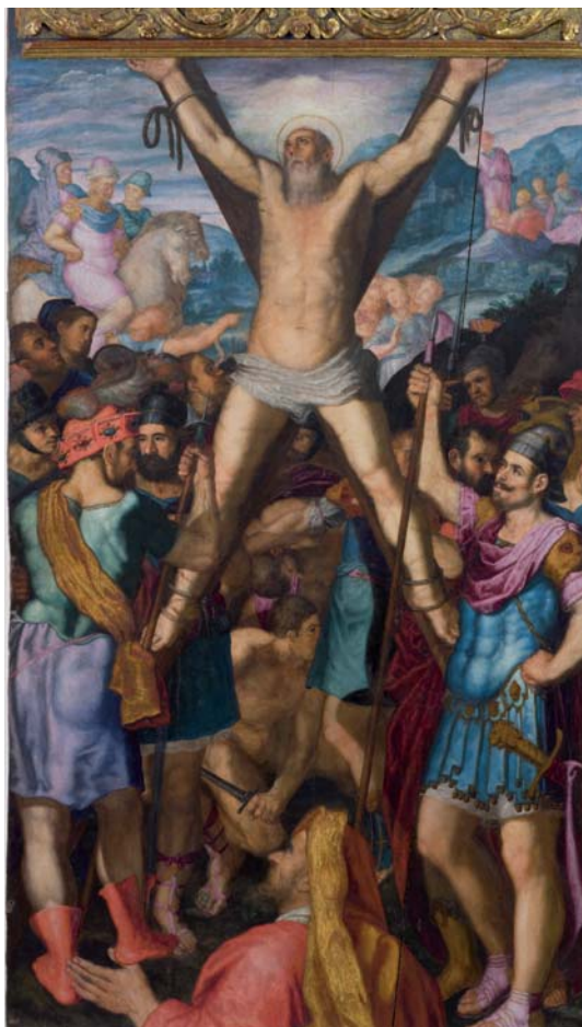
Figura 12. Giovanni Battista Toscano. Mort de sant Andreu . Retable major de l'església parroquial de Sant Andreu de Llavaneres.

verídics. I no em fixo únicament amb els rostres dels assotadors que turmenten sant Andreu o del governador romà d'Ègees i els seus oficials a l'escena de l'eculi . Em criden més l'atenció els tres sants dominicans de la predel·la del retaule del Roser de Llavaneres per la seva vivacitat palpant i una individualitat més pròpia dels retrats, mai vista al Principat en el context d'una narració devota, però visible a la pintura llombarda des de les creacions de Vincenzo Campi (1536-1591), per exemple. Malgrat la modèstia d'aquestes petites imatges de tres quarts distribuïdes al bancal del petit retaule maresmenc, les considero una pedra de toc per calibrar l'expertesa de l'autor, ja que semblen un dels seus moments més atents, concentrats i tècnicament acurats. És com si, per un moment, hagués renunciat a la manera més expeditiva i lacònica usada a la majoria de les seves taules catalanes i revelés que estava capacitat per fer un discurs força més exigent basat en un ús del color més intencionat que li permet realitzar un modelatge més matisat per recrear tres rostres tan intensos