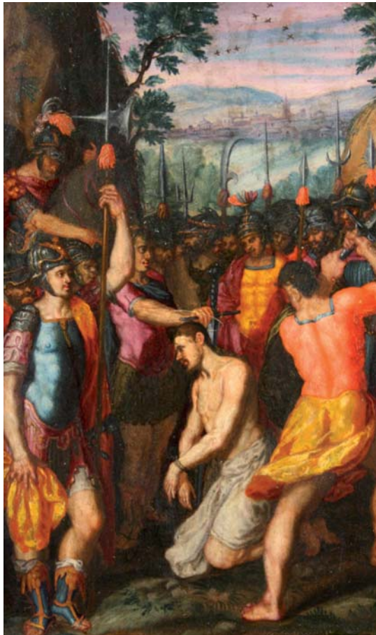
Figura 8. Giovanni Battista Toscano. Decapitació de sant Jaume . Mercat Antiquari (actualment al MNAC).

els requisits de la versemblança, dotat d'un bon dibuix i acurat en les proporcions. L'escena de la decapitació és prou indicativa de la seva destresa en aquests requisits, tant del sentit de les proporcions, també perceptible a la bona relació entre el sant i la seva cavalcadura blanca a l'episodi de la batalla, com de la definició anatòmica, ben clara al tors i els braços nus del sant, tan competent que li garantia una bona definició del moviment i de l'energia, ben indicats a l'ímpetu violent del poderós botxí que descarregarà l'espasa al coll de l'apòstol, remarcats pel voleiar del faldó, o, en la taula de la batalla de Clavijo, en el soldat cristià que tanca la composició a l'esquerra, carregant tota la força per enfitorar l'enemic.