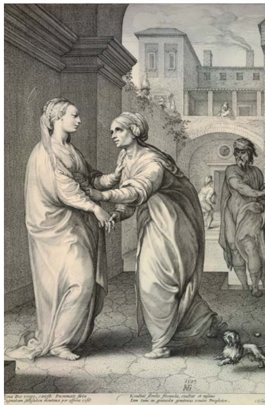
Figura 7. Hendrick Goltzius. Visitació de la Verge Maria a santa Elisabet .

Ja instal·lats en el relliscós terreny atributiu, potser és el moment oportú de proposar, també, la incorporació al catàleg del mestre de les quatre pintures d'un retaule de sant Jaume amb representacions de la vida, el martiri i els miracles de l'apòstol: l' Aparició de la Verge del Pilar , la Captura de sant Jaume , la Decapitació de sant Jaume i Sant Jaume a la batalla de Clavijo , ingressades al MNAC l'any 2011 (figura 8) 30 . Trobo que llur relació amb Joan Baptista Toscano es pot considerar segura: els tipus humans, el cromatisme, el vestuari dels militars, els barrets plomejats, la roba de la resta de personatges, els fondals malvosos puntejats d'esquemàtiques aus negres es reveuen fàcilment als treballs de l'autor i, en especial, a la seva obra més emblemàtica i ambiciosa del major de Llaveneres. D'altra banda, malgrat la senzillesa de la comanda i la manera expeditiva que hi adopta el mestre, algunes d'aquestes evidències insisteixen a recordar-nos que Toscano era un pintor preparat per satisfer