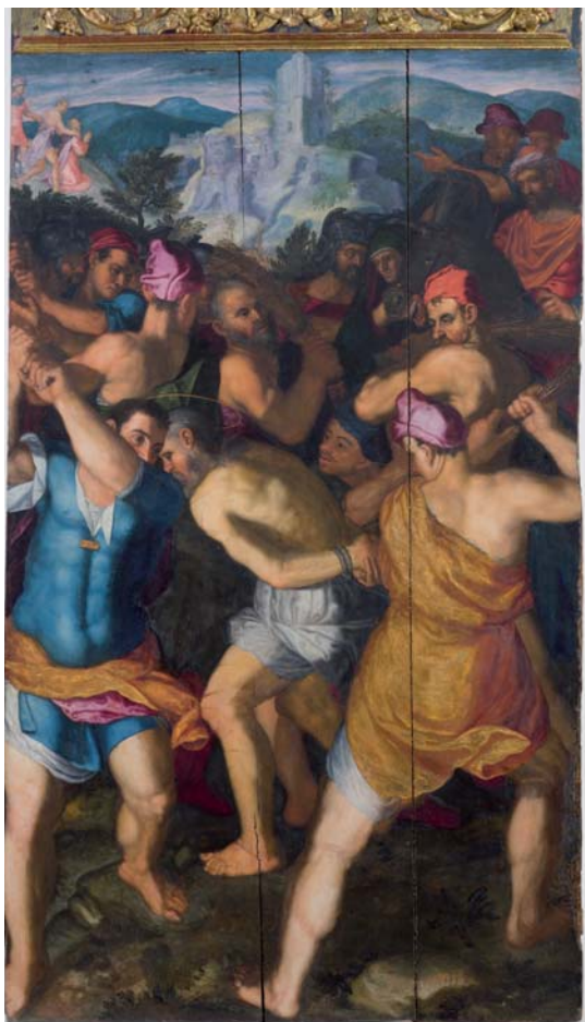
Figura 11. Giovanni Battista Toscano. Flagel·lació de sant Andreu . Retable major de l'església parroquial de Sant Andreu de Llavaneres.