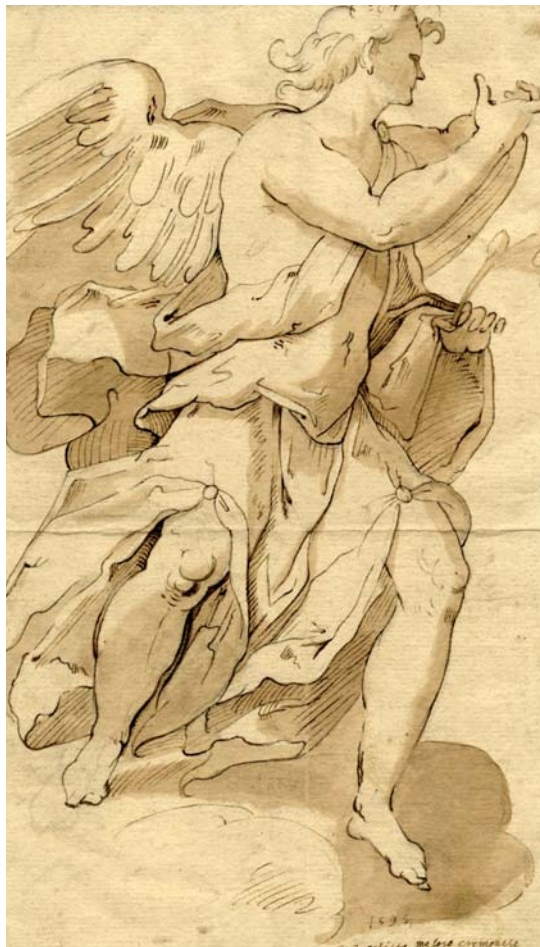
Figura 10. Giovanni Battista Trotti, «il Malosso». Arcàngel Gabriel.

a intent d'eixamplar els marges interpretatius de l'autor, i també a fi d'abandonar un moment els camins tan segurs que segueix la meua narració tan ben fonamentada en fiable documentació, com també per proposar, tímidament, alguns referents que Toscano podria haver emmagatzemat en la seva primera etapa llombarda 40 .