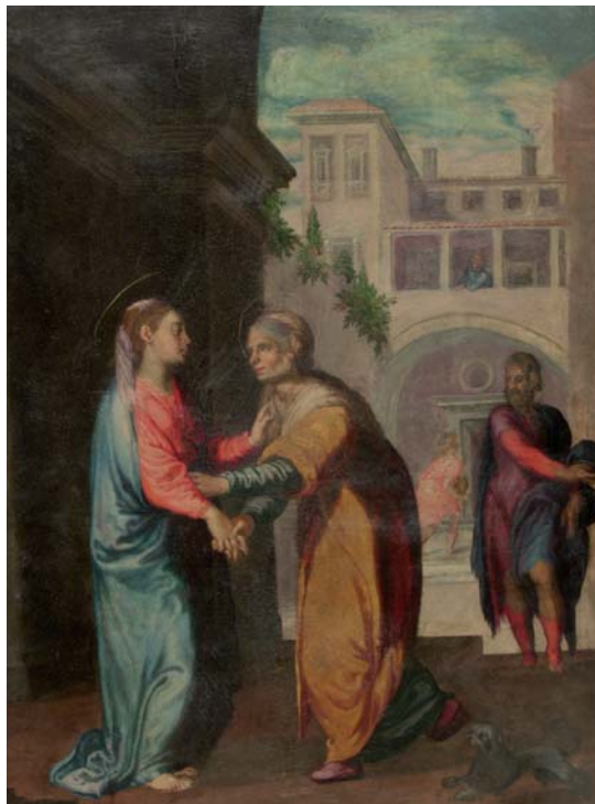
Figura 5. Giovanni Battista Toscano. Visitació de la Verge Maria a santa Elisabet . Museu de Mataró.

clarien una figura escultòrica de la MaredeDéu juntament amb les tres referències de la predella a l'orde dominicà impulsor de la devoció, a les quals s'afegiria la de l'escena de St. Domingo agenollat que pren lo rosari de ma del Jesuset , realitzada més tard, després de l'any 1634, segons consta en una anotació del Llibre de Visites pastorals conservat a l'Arxiu Parroquial que m'ha facilitat l'arxiver Lluís Albertí. Però, com indicaré de seguida, la raonable possibilitat que una de les pintures del conjunt fos la Visitació ens inclina a creure que el canvi d'autor anà acompanyat d'un nou plantejament temàtic.