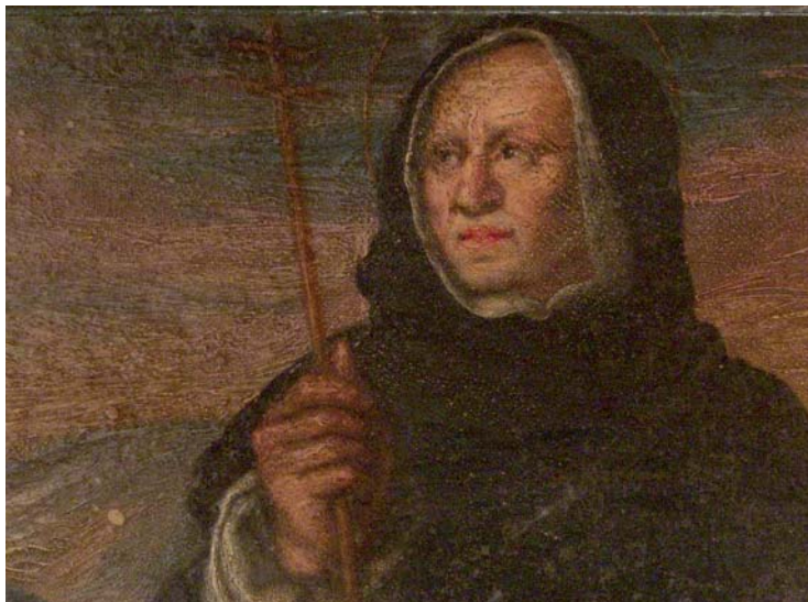
Figura 4. Giovanni Battista Toscano. Sant Domènec de Guzmán (detall) del retaule del Roser de l'església parroquial de Sant Andreu de Llavaneres.

pel treball del daurador. Com indica una vegada més el text dels acords, la màscara decorativa, menuda i variada, no és innòcua a efectes de significació i simbolisme, sinó precisa i meditada. A les polseres, alineats verticalment, hi ha feixos amb espases, llances, destrals, serres, albardes, rodes eriçades de claus, dagues, buiracs plens de sagetes, una graella i sogues, i al fris corinti, una cadena de corones i palmes que ocupen el lloc que al gravat correspon als símbols pontificals i eucarístics. Instruments i atributs, doncs, al·lusius a la tortura, al martiri i a la recompensa dels màrtirs, tant «uns tropheos so és impropèris de tots los martiris de tots los martiris», com «unas coronas y palmes a propòsit representatiu y significatiu de tots los sants».